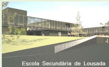
Biblioteca + Professores de Português